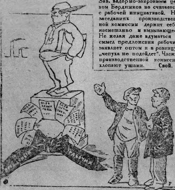
— Рабочие: зачем поставили? Да ведь каждому любопытно посмотреть. Такие завы в Советском Союзе — редкость!