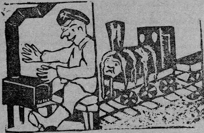
Ну уж, шнур я пойду от такой благодати куда-то на мороз, к паршивым паравозам